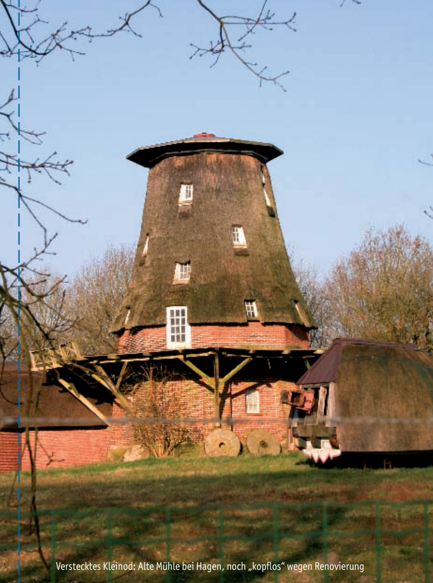
Verstecktes Kleinod: Alte Mühle bei Hagen, noch „kopflös“ wegen Renovierung

Wundern Sie sich nicht, wenn Sie auf dieser „Berg-Route“ keinen Berg entdecken können. Bei einem „Berg“, der sich gerade einmal zwölf Meter über das Umland erhebt, kann Gipfelglück auf 19 m über NN im wahrsten Sinne des Wortes flach fallen – umso besser lässt es sich radeln! Deutlich werden dafür auf der Tour um den Kahlen Berg die Unterschiede zwischen Geest und Marsch.